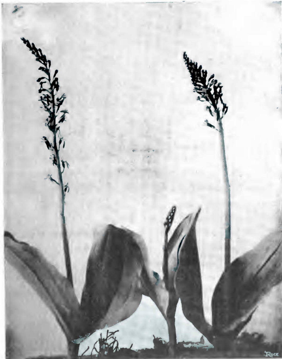
LISTÈRE OVALE ( Listera ovata )