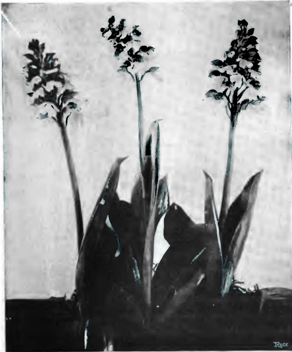
ORCHIS POURPRE ( Orchis purpurea )