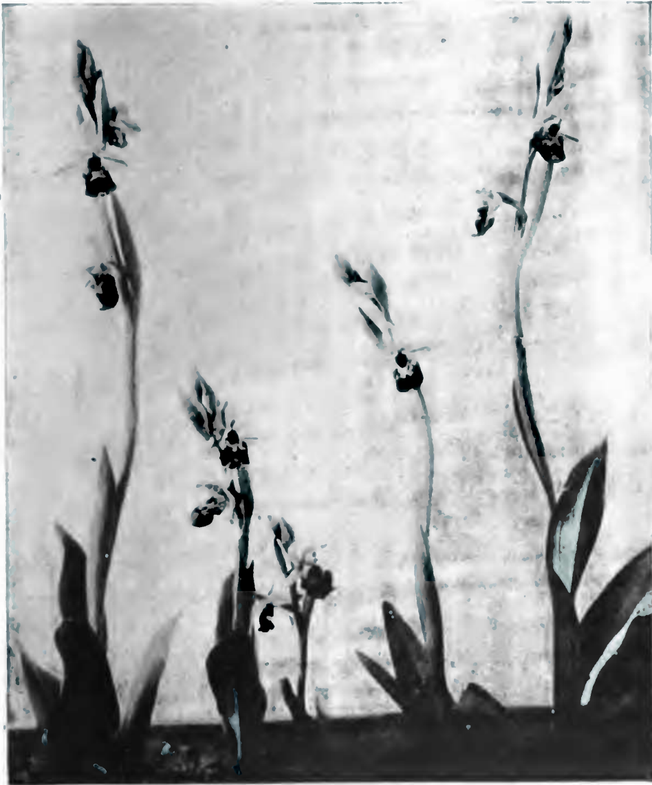
OPIRYS FRELON (O. arachnites)