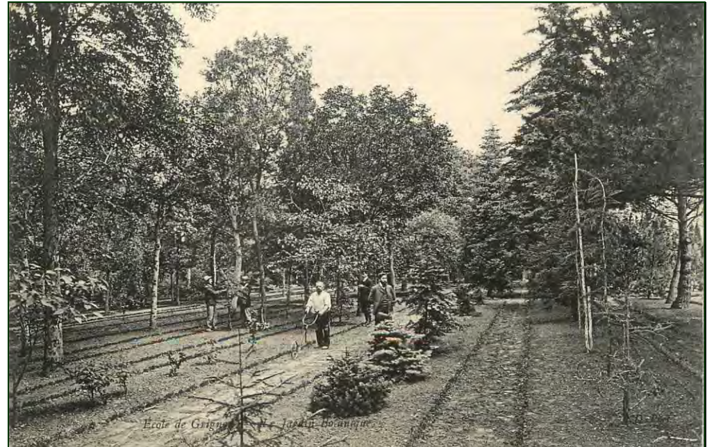
Jardin dendrologique vers 1910

« L'arboretum de l'école nationale de Grignon, que j'ai commencé en 1873, a été surtout créé dans le but d'offrir aux jeunes gens de ce grand établissement scientifique les moyens d'étude en vue de la connaissance des principaux arbres indigènes et exotiques, et présentant un certain intérêt cultural ou scientifique. Cet arboretum comprend aujourd'hui plus 2.000 espèces ou variétés de pleine terre sous le climat de Paris, et leur nombre s'augmente chaque année ; elles sont classées par familles et genres disposés en séries linéaires, méthode très commune pour l'étude ».