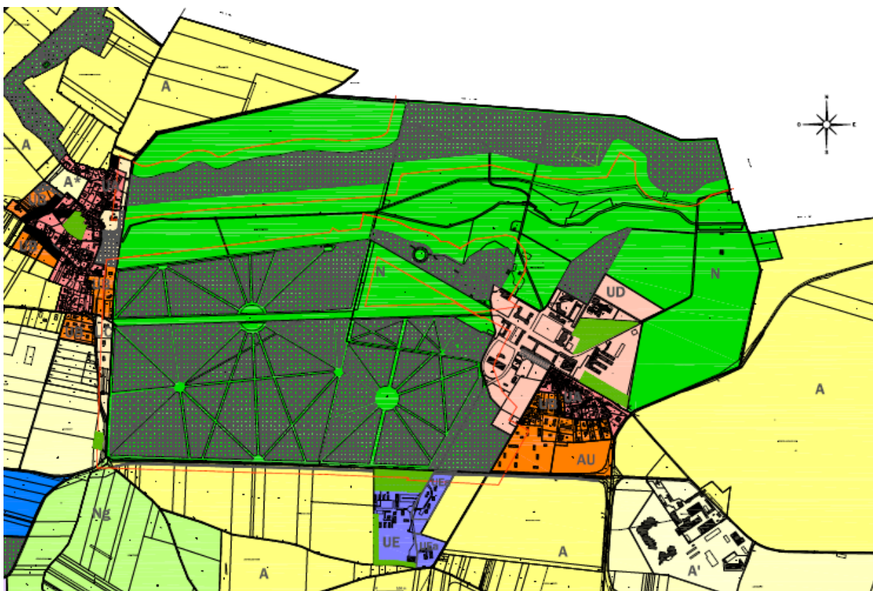
Plan de zonage